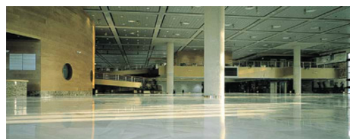
HALL PLANTA PRINCIPAL