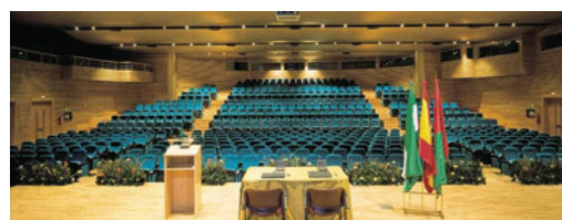
AUDITORIO. SALA FALLA

LUGAR DE EXPOSICIÓN Hall planta principal